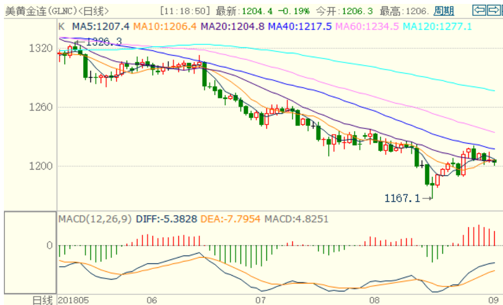
图 1：COMEX 黄金主力合约技术分析