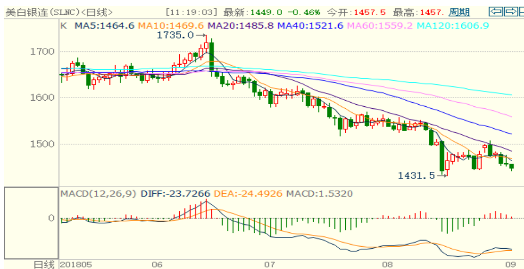
图 2：COMEX 白银主力合约技术分析